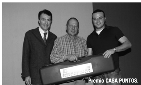
Premio CASA PUNTOS.