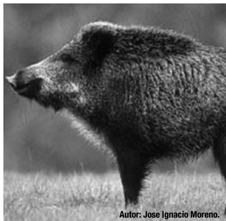
Autor: Jose Ignacio Moreno.

Posteriormente nos introdujo en los aspectos y condicionantes que debe de tener una cacería, indicando que el éxito de una batida no se improvisa, es fruto de un esfuerzo común, estudiando previamente la situación, planificando la estrategia a seguir por todos los participantes, con un correcto comportamiento durante el desarrollo de la misma y teniendo en cuenta, sobre todo, las medidas de seguridad necesarias para evitar accidentes y el respeto por todas las personas que disfruten de la naturaleza de una forma diferente a la nuestra.